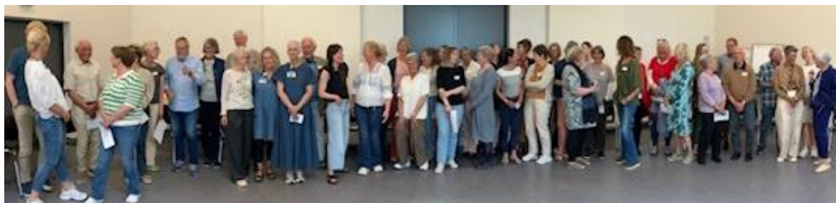
fra temadag

Godt 45 mennesker var samlet på Dalum Landbrugsskole mandag 12. maj 2025 til den årlige temadag i PFN.