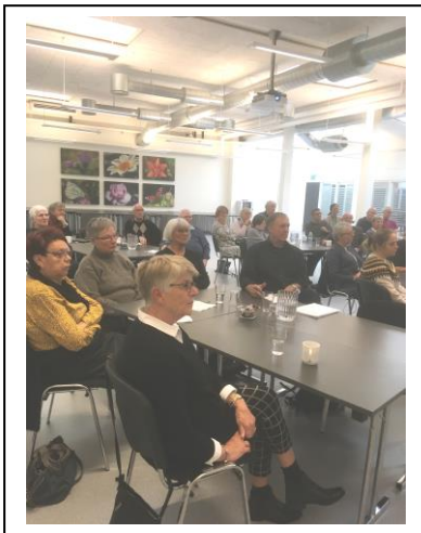
Stemmingsbilleder fra teamdagen.

Efter oplægget blev der ved bordene arbejdet med 'værdikort', og det blev drøftet hvilke værdier, der betyder mest, og hvad man mener med sine værdiudsagn.