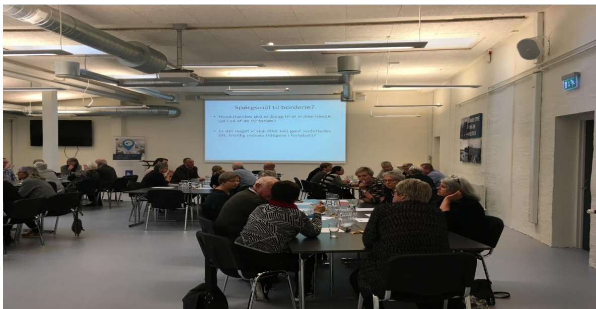
Billede fra den årlige temadag 21.11.2017