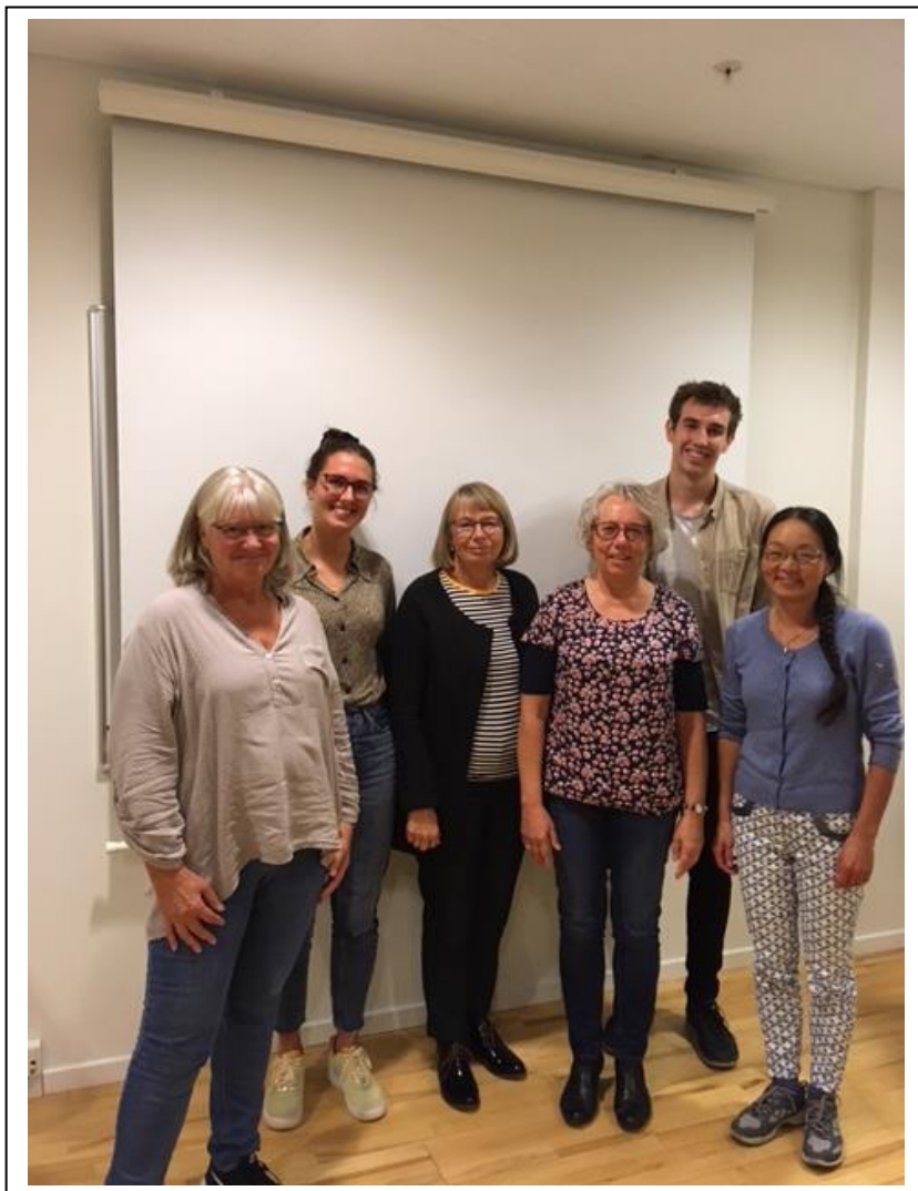
Billede fra introduktionsforløb for frivillige i PFN